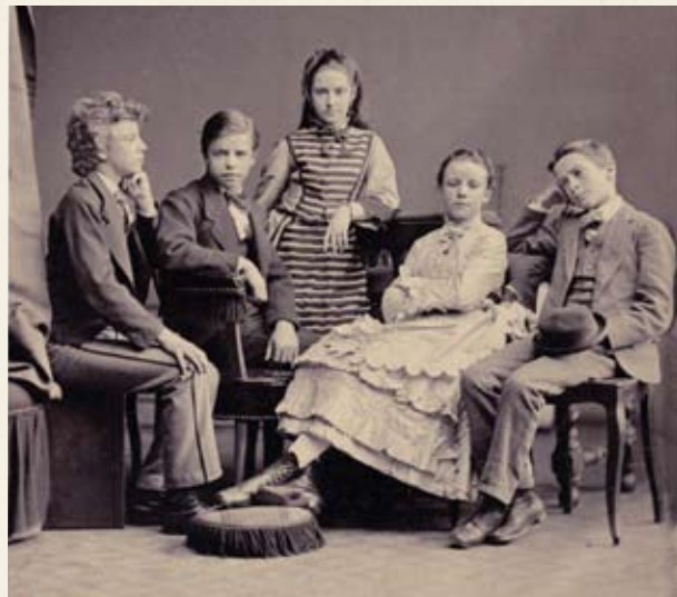
אחת המשפחות האמריקאיות החשובות שביקרו בארץ הקודש הייתה משפחת רוזוולט. בתמונה תיאודור רוזוולט שני משמאל.

אמצע המאה ה-19 הייתה תקופה של שינויים פוליטיים נרחבים ושל מודרניזציה בלתי נמנעת. מסעות התאפשרו הודות להתפתחויות הטכנולוגיות, במיוחד ספינת הקיטור המונעת על ידי פחם והטלגרף החשמלי, אפשרות הלינה בבת-מלון והופעתן של סוכנויות נסיעות מאורגנות. באופן ייחודי לאמריקאים, בעקבות מלחמת האזרחים (1861-1865) סיפקו המסעות לארץ הקודש, אז חלק מן האימפריה העות'מאנית, הזדמנות להתחדשות רוחנית.