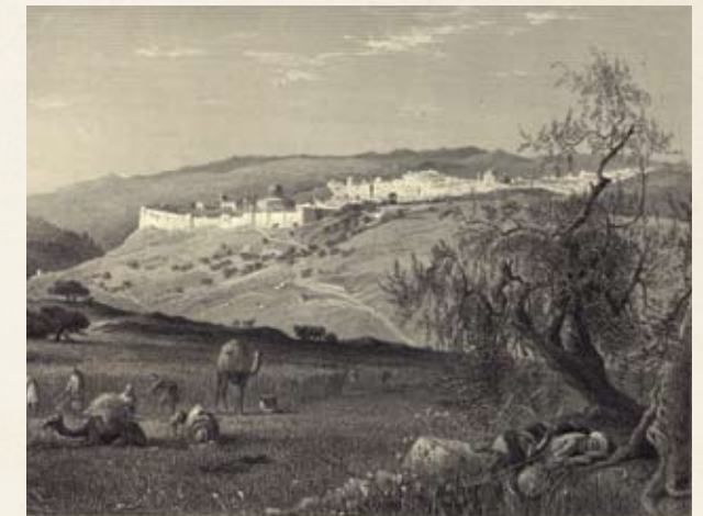
ירושלים מהר הצופים. תחריט מתוך: וילסון, צ'ארלס, ארץ ישראל הציורית, (בתצוגה).

מיסיונרים, צליינים ותיירים, ארכיאולוגים וחוקרי מקרא, מתיישבים וקצינים קונסולאריים שהגיעו לארץ הקודש במאה ה-19 מצאו מקום שקשה היה להעלותו על הדעת. אולם הרגש שהמקום כמושג עורר בהם כאשר חלמו עליו – נותר על כנו. בין שהושפעו ממידת העניין הגוברת של מדינות מערביות אחרות או מן העובדה כי הארץ הלכה ונעשתה נגישה יותר, ובין שהיה זה השיפור בתחום התחבורה – אותם הביקורים המוקדמים היו ראשית היווצרותו של קשר מיוחד לארץ הקודש, המשפיע על פוליטיקאים ועל מקבלי החלטות אמריקאים עד עצם היום הזה.