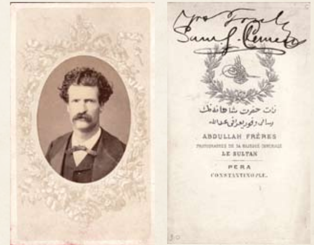
תמונה חתומה של מארק טווין, צולמה בקונסטנטינופול בדרך לארץ הקודש, ספטמבר 1867.