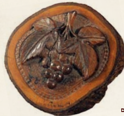
ענפי עץ זית פרוסים ומגולפים בדוגמאות שונות אשר שימשו כמזכרות.