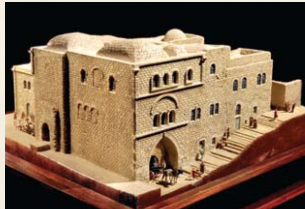
דגם של מלון מדיטרניאן במיקומו השני בשנת 1867, בתקופה בה שהה בו מארק טווין. קנה מידה 1:75.

בתערוכה זו זוכה הסופר וההומוריסט מארק טווין למקום נכבד. רשמיו ממסעותיו ומהרפתקאותיו בארץ הקודש שקובצו בספר התמימים בחוץ לארץ (1869) תרמו לראשיתו של עידן חדש בספרות המסע.